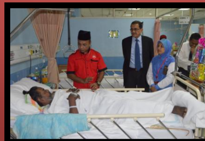
Majlis Sumbangan Aidilfitri Kepada Pesakit oleh MAIWP